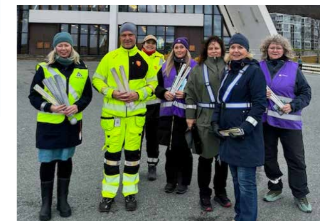
▲ Årets refleksdag markerte vi i Tromsø sammen med Bufetat region nord, Fosterhjemstjenesten Nord-Norge og Troms fylkeskommune.

Den 17. oktober markerte vi årets refleksdag sammen med Bufetat, region nord, Fosterhjemstjenesten Nord-Norge og Troms fylkeskommune. Vi informerte om refleksbruk og delte ut reflekser ved Tromsdalen kirke (Ishavskatedralen) og Tromsøbrua. Vi fikk god pressedeckning gjennom NRK radio. Avisa iTromsø omtalte også saken. I flere av kommunene som er godkjent som trafikksikker kommune i