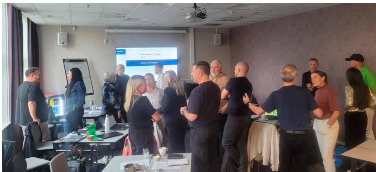
▲ Ungdomsskolelærere i valgfaget trafikk møttes til samling i Tromsø høsten 2024.

Trygg Trafikk Troms har i 2024 rådet kommuner til å inkludere barn og ungdom i trafikksikkerhetsarbeidet i forbindelse med Trafikksikker kommune og Hjertesone.