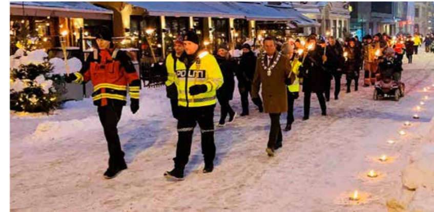
Fakkeltog på Trafikkofrenes dag i Buskerud.