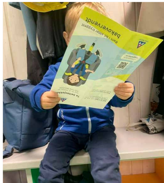
▲ Gutt i barnehagen leser brosjyre om sikring av barn i bil.